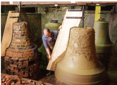
Bild 5 Links mit Lehmsteinen aufgemauerter Kern, rechts Fertigstellen des Kernes durch Schablonieren

Auf diesen Kern trägt man Lehmschichten bis zur Stärke des Abgusses, Falsche Glocke genannt, auf, schabloniert (Bild 6) und trocknet sie. Dieses Modell wird mit den gewünschten Verzierungen und Schriften versehen.