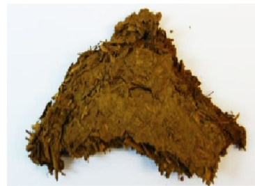
Bild 3 Lehm, der nach dem Abguss als Formstoff wieder verwendet wird

Naturformsand, dazu gehört auch der zum Formen von Glocken verwendete Lehm , besteht aus einem Gemenge aus Quarz ( \text{SiO}_2 ) und Ton, einem wasserhaltigen Aluminiumsilikat ( \text{Al}_2\text{O}_3 \cdot 2\text{SiO}_2 \cdot 2\text{H}_2\text{O} ). Hinzu kommen noch geringe Beimengungen anderer Mineralien, die den Formsand färben.