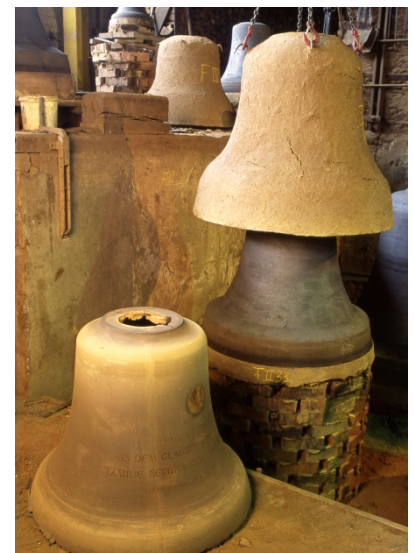
Bild 8 Aufsetzen des Mantels, Fertigstellen der Glockenform. Links unten Falsche Glocke

Buchstaben und Bilder werden aus Wachs erstellt und auf die Falsche Glocke aufgesetzt. Dieses Wachs wird während des weiteren Formprozesses ausgebrannt. Im Lehmformverfahren kann die gesamte Form über längere Zeit so erhitzt werden, dass keine Wachsrückstände in der fertigen Form verbleiben. Somit können sehr komplizierte Strukturen im Lehmformverfahren, auch mit Hinterschnitten, im Mantel abgebildet werden (Bild 8).