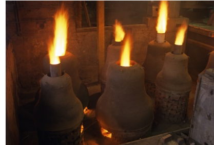
Bild 7 Trocknen der Glockenform durch Befeuern des Hohlraumes

Auf die getrocknete Falsche Glocke werden nunmehr Lehmschichten für den Mantel aufgebracht. Der getrocknete Mantel wird schließlich vorsichtig abgehoben, die Falsche Glocke vom Kern entfernt, der Mantel wieder auf den Kern gesetzt, in der Grube mit Erde eingedämmt und gießfertig gemacht. Der durch das Entfernen der Falschen Glocke erzeugte Hohlraum wird mit Glockenbronze ausgegossen.