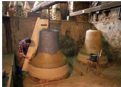
Bild 6 Schablonieren der Falschen Glocke